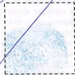
Huella Digital del Pulgar Derecho.