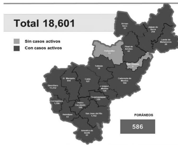
Mapa de casos activos COVID-19: 22 DE NOVIEMBRE 2020 1

Con estadísticas de la “Base de Datos Estatal COVID-19” publicada por la Secretaría de Salud de Gobierno del Estado, se tienen hasta el 22 de noviembre de 2020, 61 casos activos de COVID-19 en el Municipio de Amealco de Bonfil, Querétaro; lo que representa un 0.94% del total de la población; misma que de acuerdo al último censo publicado por INEGI en el año 2010, era de 62,197 habitantes, de los cuales 32,355 son mujeres y 29,842 son hombres.